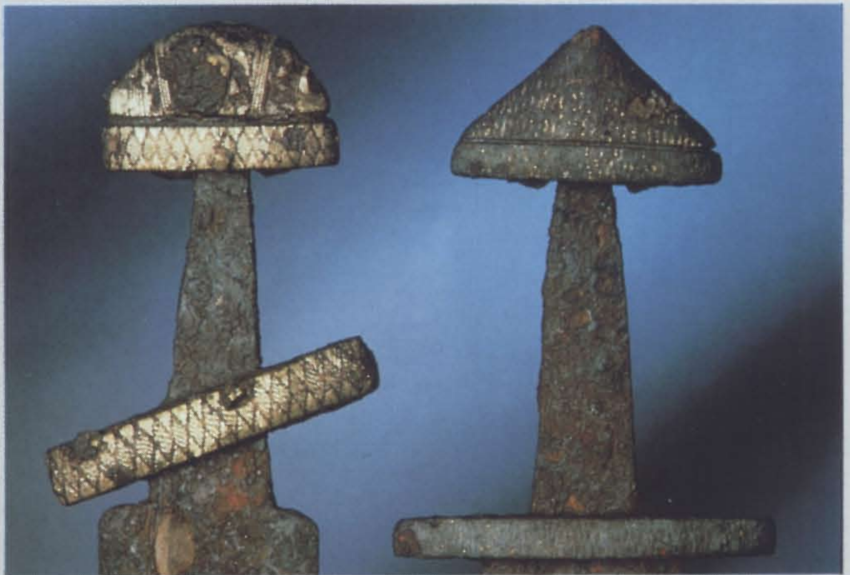
Ein Schwert aus der Zeit um 900 bis 950. Gefunden 1989/90.