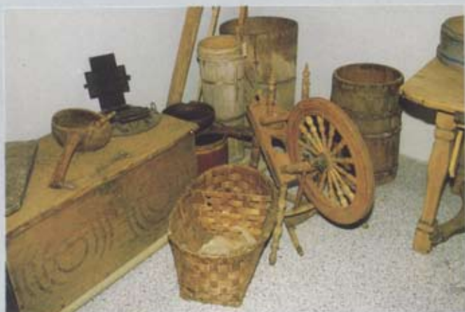
Über 3000 Gegenstände sind registriert.