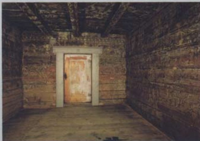
Mitte: Prachtvolle Renaissancetür im Königssaal. Unten: Kammer mit Blattdekor von 1675.