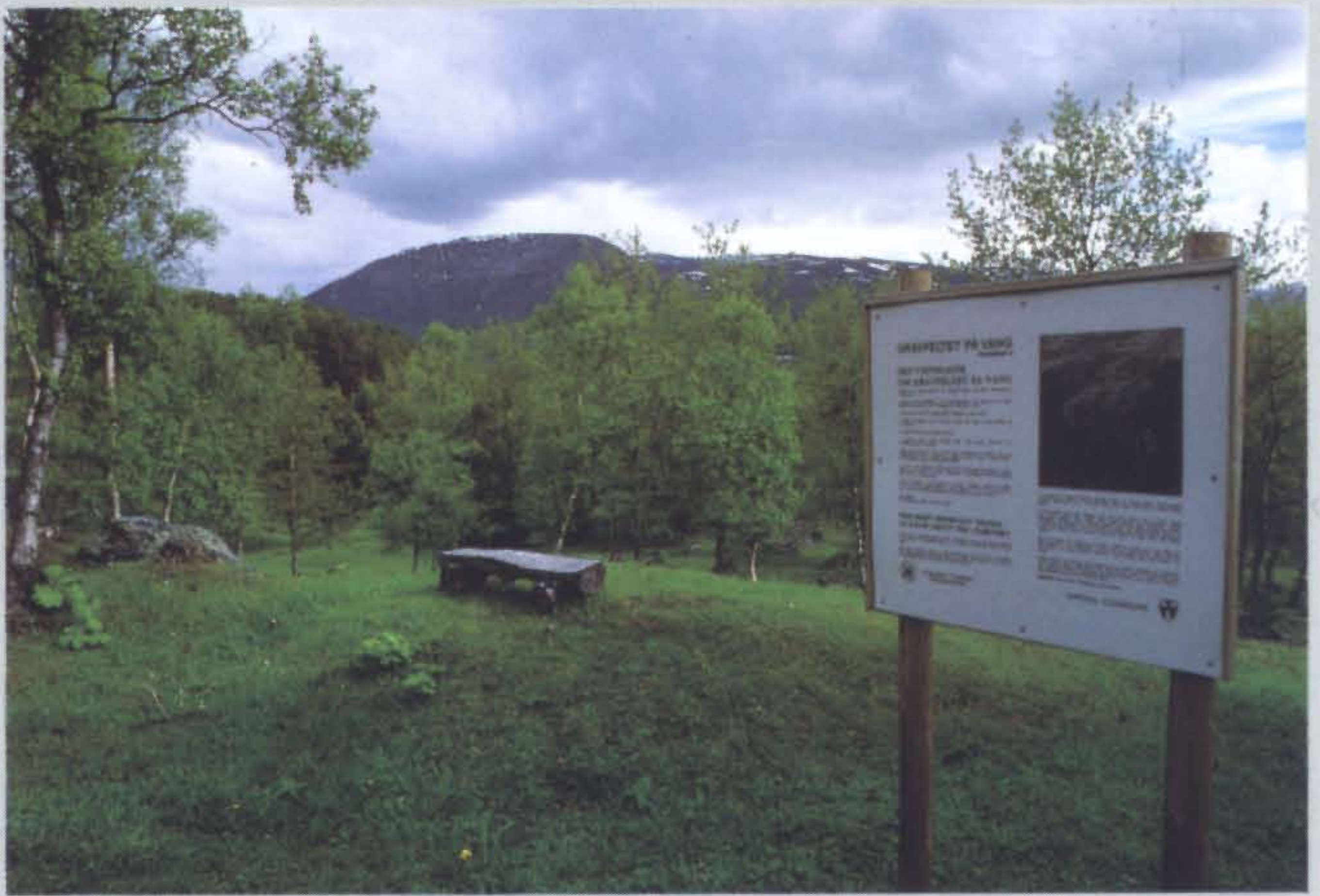
Informationstafeln sind für Interessierte von grosser Hilfe.