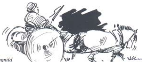
Text: Odd M. Vognild

Ein Besuch im Raulåna-Gebäude ist eine Wanderung durch die Geschichte – vom Barock bis in unser Jahrhundert hinein.