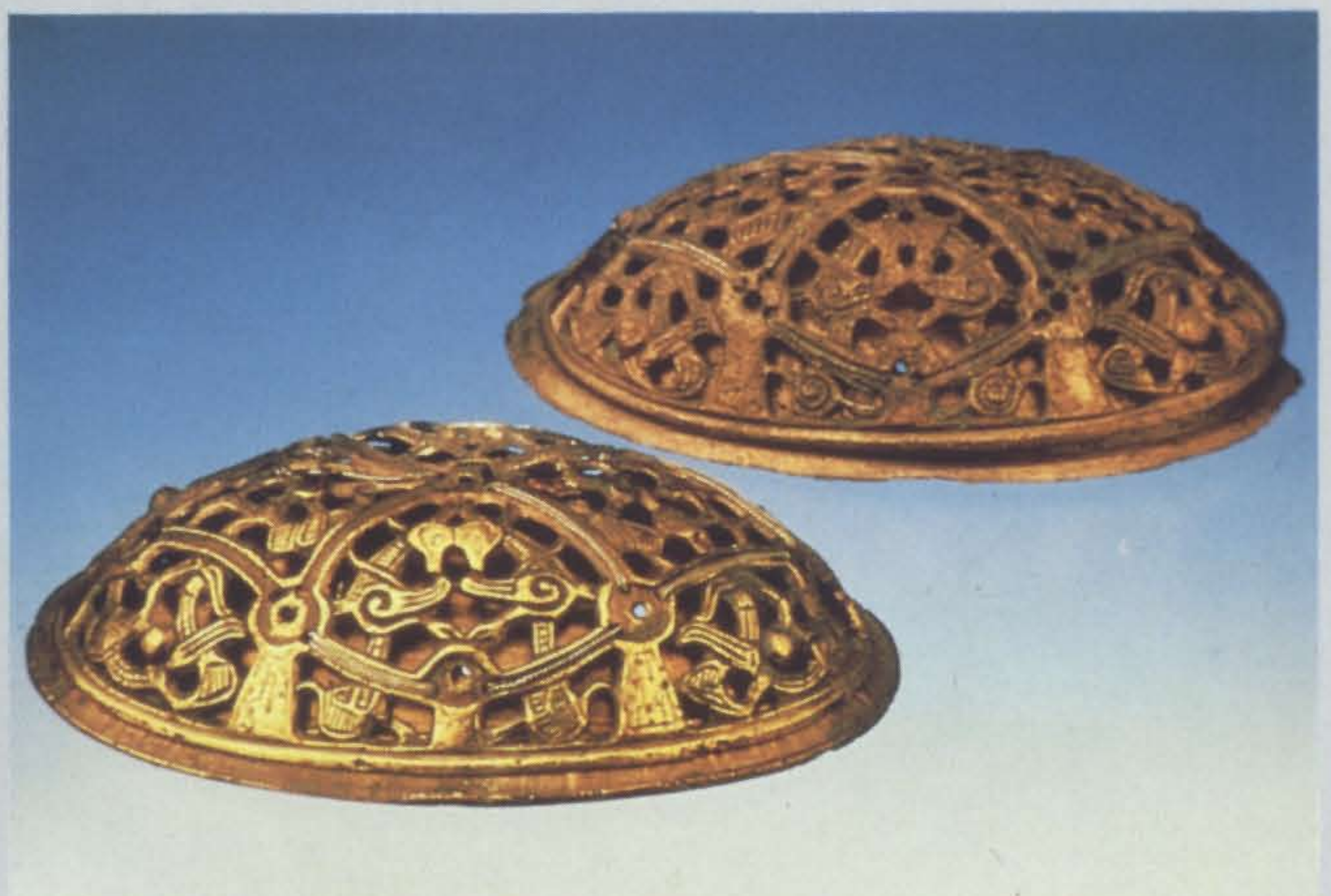
Schalenspangen aus der Zeit um 900. Gefunden ca. 1880.