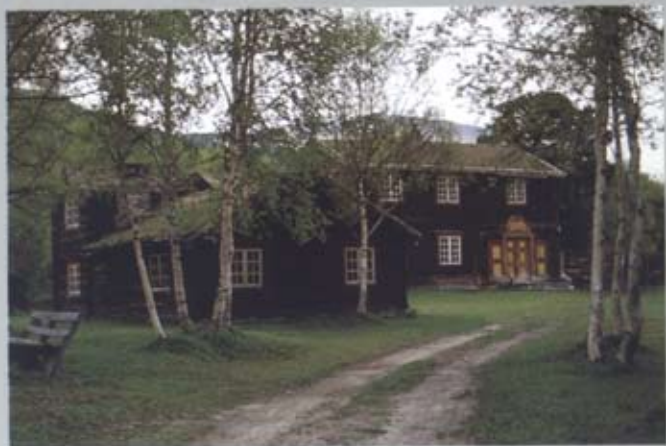
Fjellkåsa – eine idyllische Landschaft.