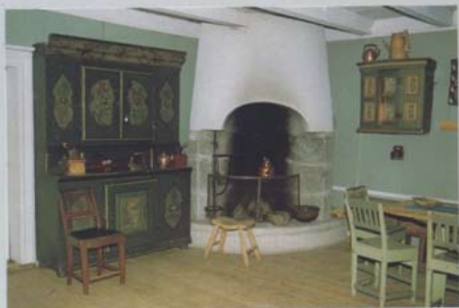
Interieur der Skjörstadtuggu.